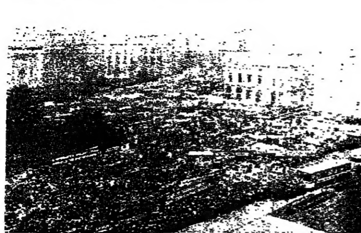
المتظاهرون... قبل لحظة من الحجز الجديدة

وفي بكن رأت الصين في رد فعل على القمع الدموي لمتظاهري تشاوتيسكو قلقا على نظام نيكولاي تشاوتيسكو وقررت حل شؤونها الخاصة بالطريقة المناسبة.